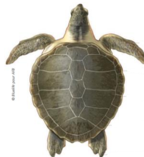
Tortue de Kemp ( Lepidochelys kempii )