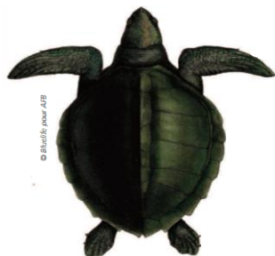
Tortue olivâtre ( Lepidochelys olivacea )