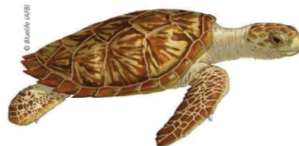
Tortue imbriquée ( Eretmochelys imbricata )