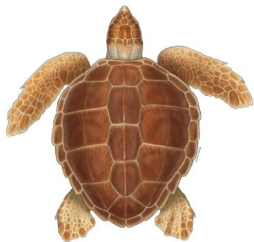
Tortue caouanne ( Caretta caretta )