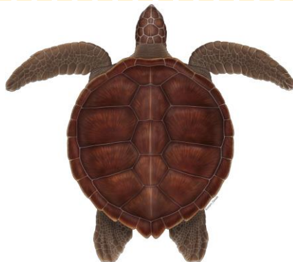
Tortue verte ( Chelonia mydas )